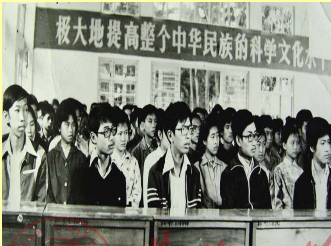
复办开学典礼上的港澳同学

“关于华大的停办，有一点我一定要说，华大并没有撤销，华大一直都是存在的，而且廖公也一直都是华大的校长。”李老师强调道。华大一直都在，因为它重要，它无可替代。