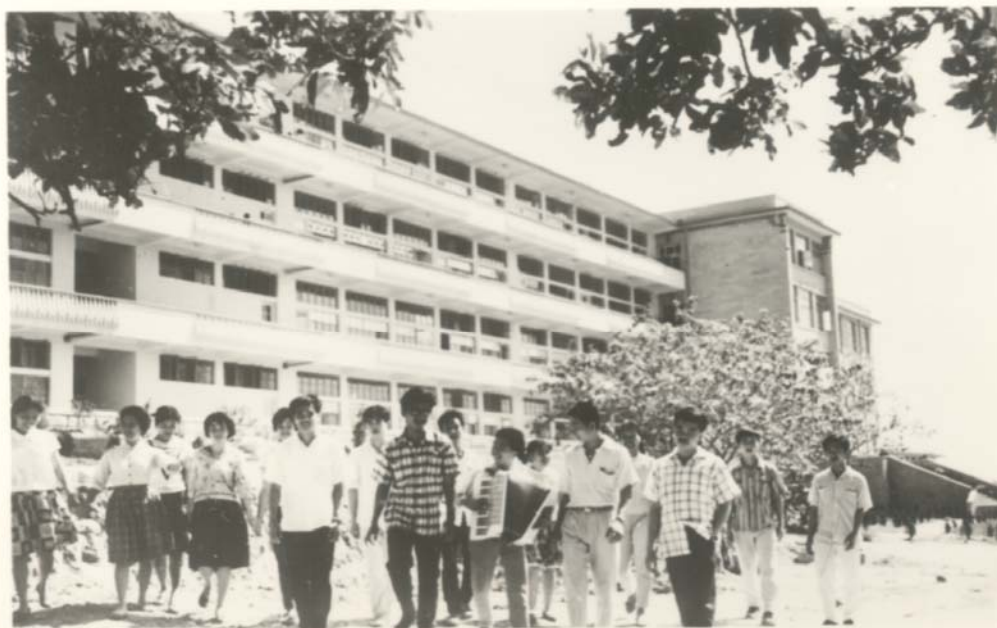
1963 年课余时间，同学们漫步在校园里

看着如今的华园，教学楼整齐美丽，道路宽敞平整，往后的华大人谁能不感激那些为华大建设付出过的人们。当然，只要置身华园之中，我们就永远可以享受一片绿荫，这无疑是难得的幸福。