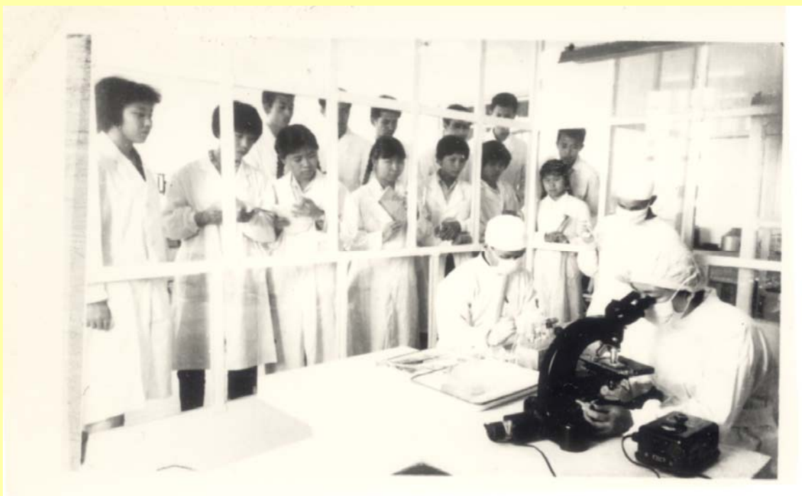
1963 年医学系学生在实验室